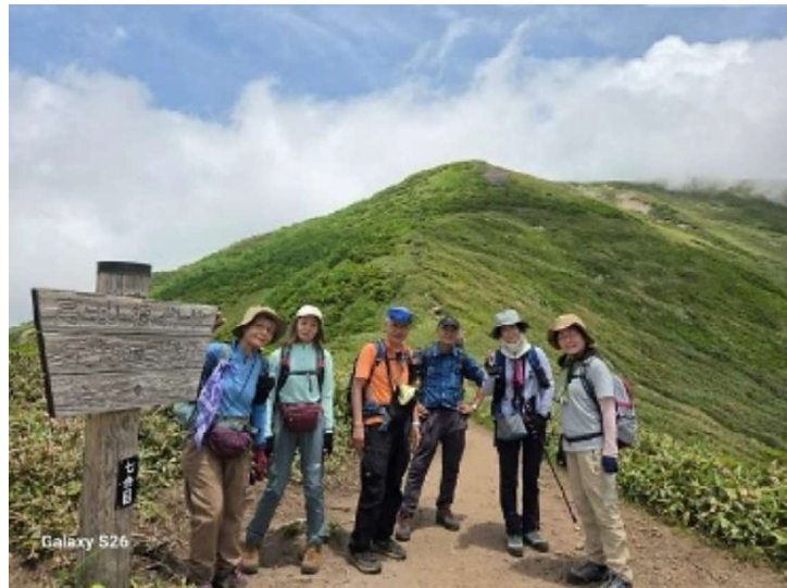
あと少しで頂上(7合目)