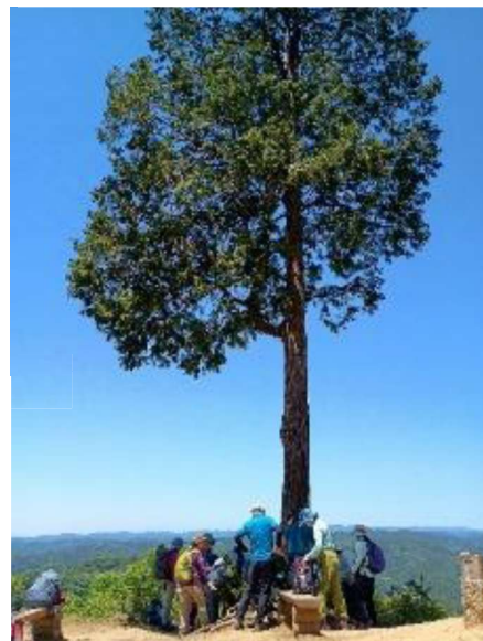
通称「トロの木」大き〜い