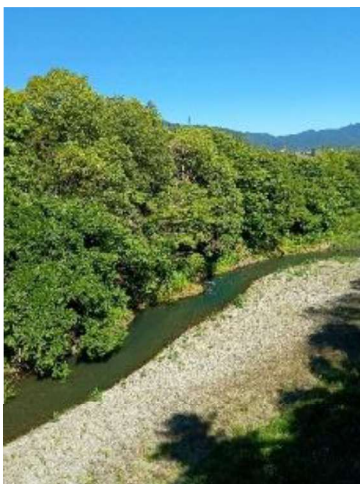
多摩川を越えて歩きます