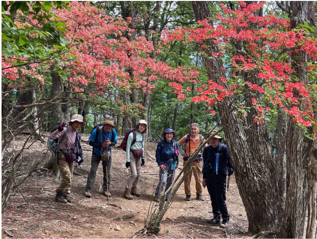
ツツジのトンネル