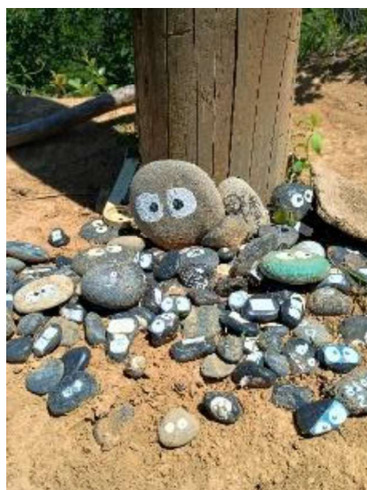
会いたかったよ「まっくろくろすけ」