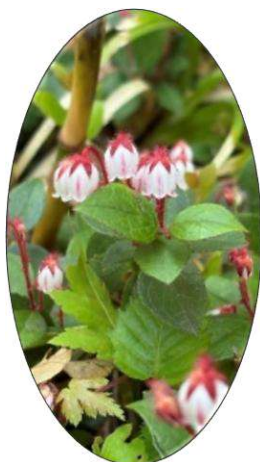
登山道に咲く アカモモ