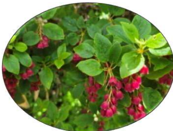
ベニバナサラサドウダン