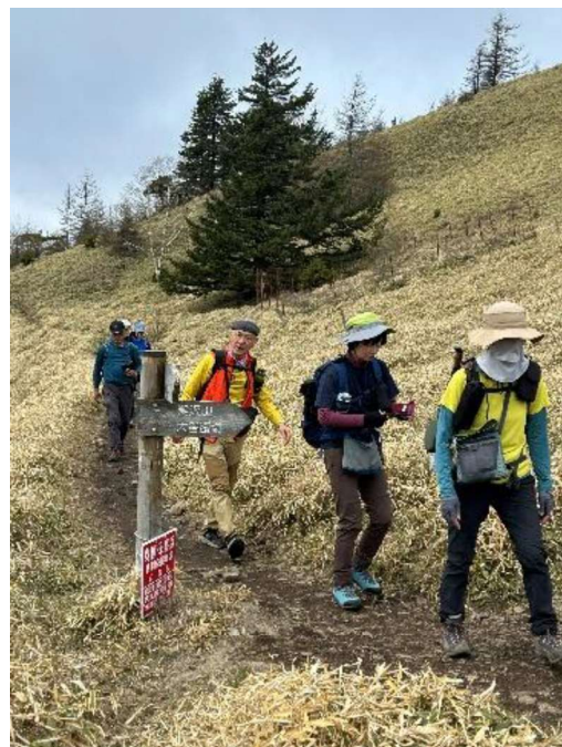
石丸峠到着お疲れ様