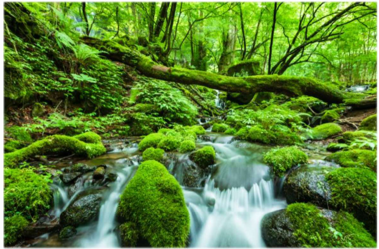
静謐の音 (2017年7月2日撮影)