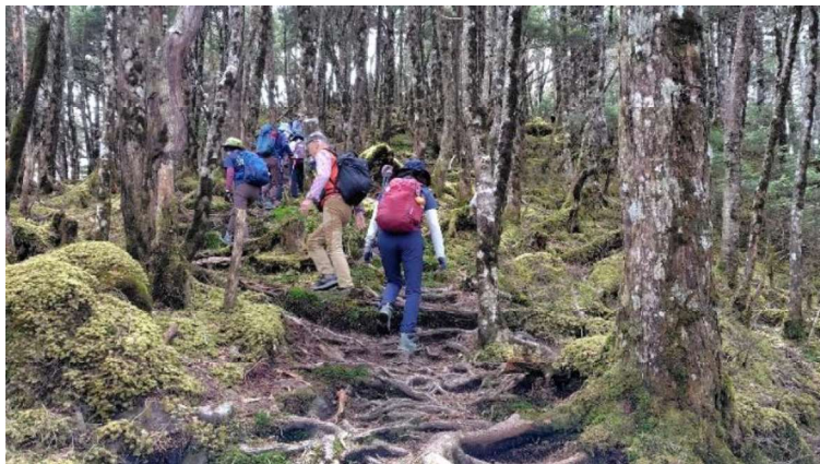
小金沢山山頂まであと少し