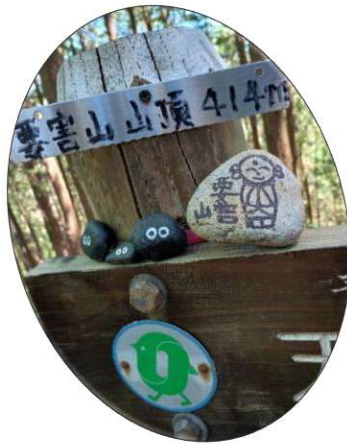
要害山にもくろすけくんが…