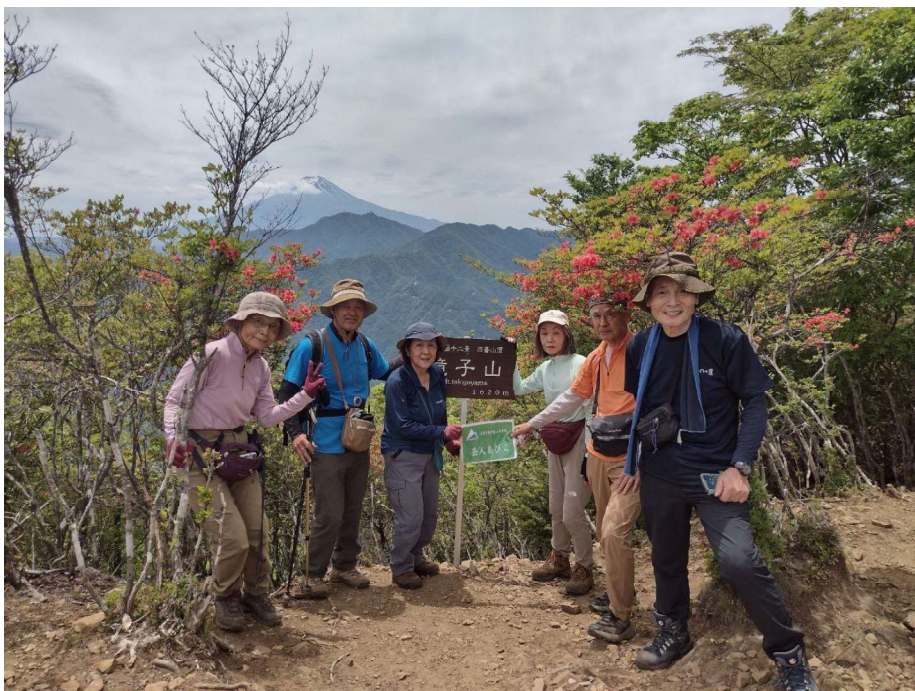
富士と滝子山山頂