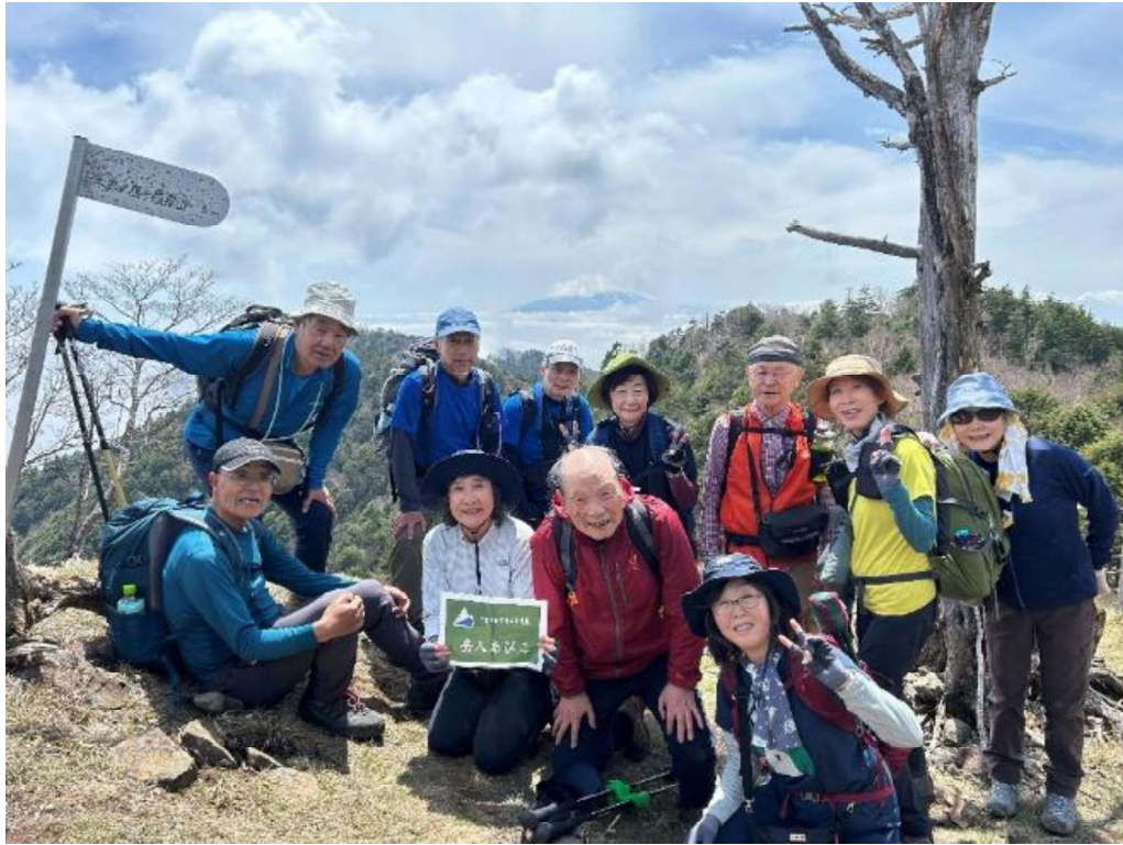
富士を背に小金沢山山頂にて