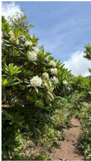
ハクサンシャクナゲ