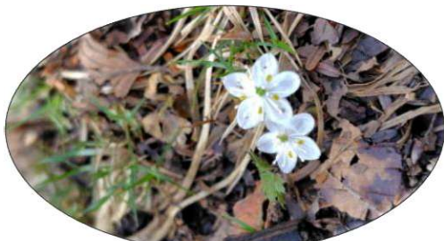
可憐なバイカオウレン