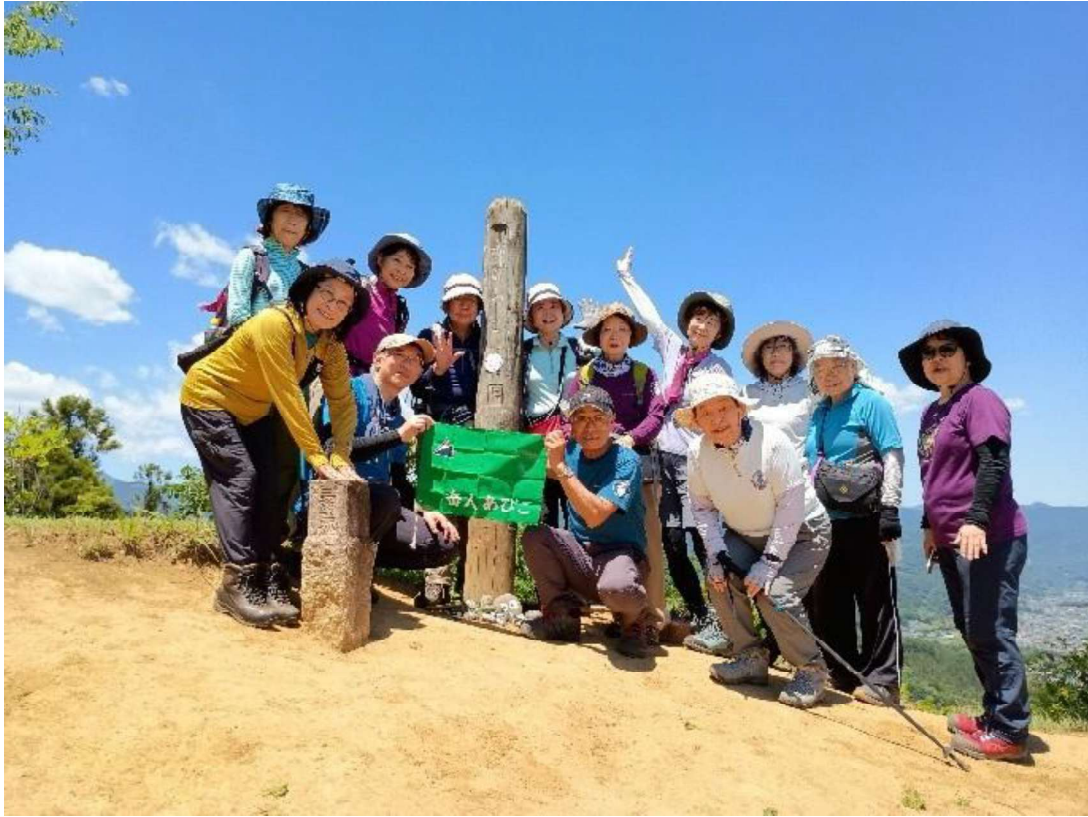
赤ぼっこの山頂で皆でパチリ