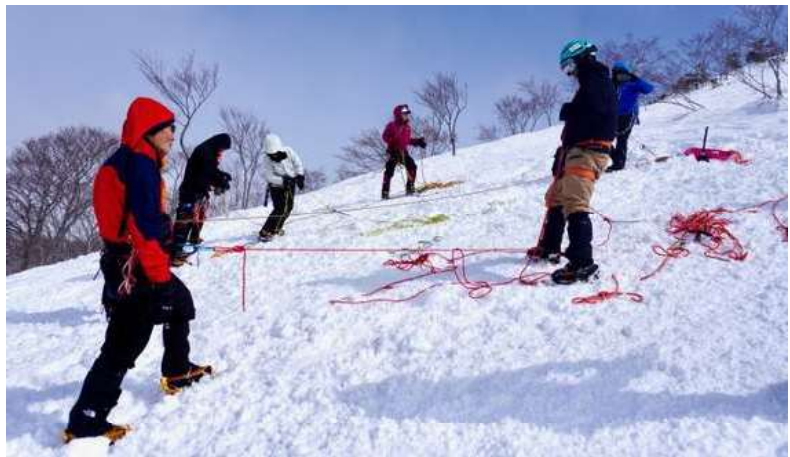
スタンディングアックスビレイの講習。ピッケルを雪中に埋め込んで支点とし、そのピッケルを足で踏んで肩絡みで登攀者を確保（ビレイ）する。加えて確保者（ビレイヤー）の安全のため最初にセルフビレイ用のアンカーもセットすることになるのでどうしても時間がかかる