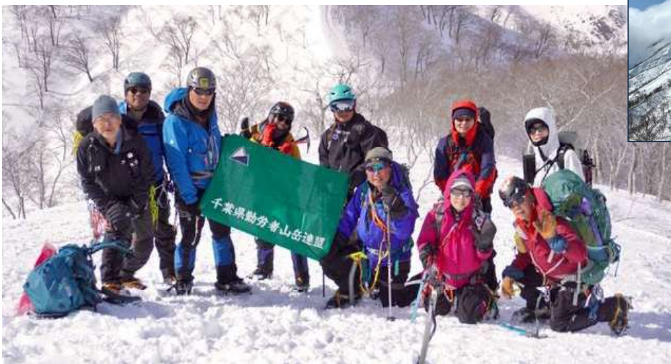
今回の講習の参加者とともに。一名少ないのは撮影者の鈴木忠浩さん