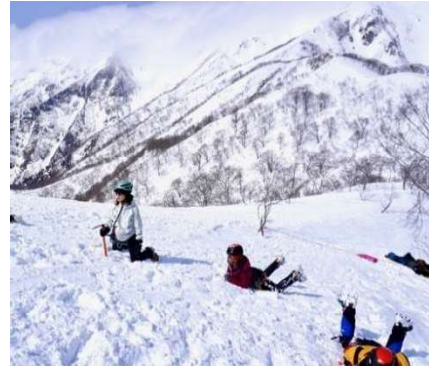
最も時間をかけたのが 滑落停止訓練 何度もトライして身体に覚えてもらう