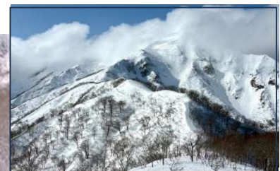
谷川岳を登るには最高のコンディションであったが今回はお預け山頂付近は常に湧き上がってくる雲に覆われていた