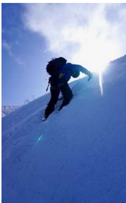
訓練場所から帰り道雪山ではどこでも歩けるので斜度50度ほどの雪壁をクライムダウンしてショートカットする参加者も