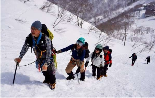
天神平から始まる急登では斜度に応じてV字歩行キックステップ、フロントポインティングを意識しながら登った